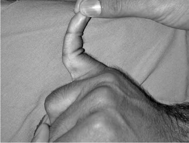
Şekil 1. Hiperekstansiyon yaralanması sonrası görülen proksimal interfalangeal eklem çıkığı olan hastanın resmi.

volar dudağının %40'ından fazlasını ilgilendiren kırıklı çıkıklar sıklıkla yan bağlarda da yırtığa neden olur. Bu yaralanmalarda kırık iyileşse bile rezidüel instabilite kalabilmektedir (Şekil 2, 3). Basit çıkıklarda altı hafta süre ile sargılama yeterlidir. Proksimal interfalangeal eklemden yan bağ yaralanması sonrası iyileşmenin 4-6 ay sürebileceği ve rezidüel eklem şişliği kalabileceği unutulmamalıdır. İnstabil PİF çıkıkları ve kırıklı çıkıklarında eğer kırık orta falanks eklem yüzü volar dudağının %30'undan fazlasını ilgilendiriyorsa ve redüksiyon devamlılığı için 30