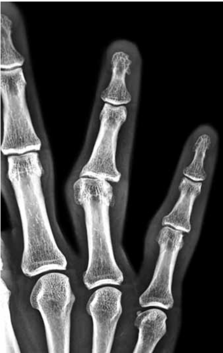
Şekil 2. Proksimal interfalangeal eklem çıkıklarının çoğuna orta falanks tabanında oluşan eklem içi kırık ve yan bağ yaralanması eşlik etmektedir.

volar dudağının %40'ından fazlasını ilgilendiren kırıklı çıkıklar sıklıkla yan bağlarda da yırtığa neden olur. Bu yaralanmalarda kırık iyileşse bile rezidüel instabilite kalabilmektedir (Şekil 2, 3). Basit çıkıklarda altı hafta süre ile sargılama yeterlidir. Proksimal interfalangeal eklemden yan bağ yaralanması sonrası iyileşmenin 4-6 ay sürebileceği ve rezidüel eklem şişliği kalabileceği unutulmamalıdır. İnstabil PİF çıkıkları ve kırıklı çıkıklarında eğer kırık orta falanks eklem yüzü volar dudağının %30'undan fazlasını ilgilendiriyorsa ve redüksiyon devamlılığı için 30