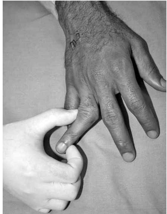
Şekil 3. Bu tip proksimal interfalangeal eklem çıkığı olan hastanın rezidüel instabilitesi.

Metakarpofalangeal eklemlerde özellikle başparmaklarda ulnar ve radial yan bağların yaralanması