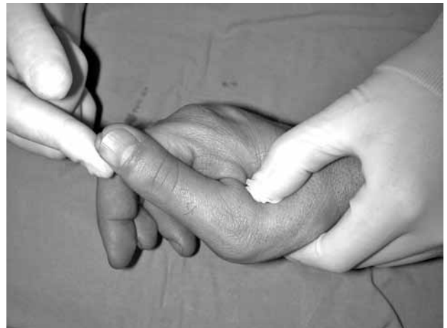
Şekil 6. Anestezi altında sağ el başparmak radial kollateral stres muayenesinde belirgin instabilite izlenmekte.

Radial kollateral bağ yaralanmaları, açık parmak üzerine düşülmesi veya top çarpması gibi durumlarda MF eklemin adduksiyona zorlanması sonucunda oluşur. [10] Radial kollateral bağ metakarp başından, proksimal falankstan veya orta kısmından yırtılabilir. Farklı çalışmalarda değişik sonuçlar olmasına karşın proksimal RKB yaralanmaları daha sık izlenmektedir. [14] Dorsal kapsüler yaralanmalar tabloya eşlik edebilir. Klinik olarak ödem, ekimoz ve dorsoradial kenarda hassasiyet sık bulgulardır. Eşlik edebilecek kırıklar nedeni ile mutlak direkt grafi değerlendirmelere eklenmelidir. Direkt grafi sonrasında stres testleri ile bağ yaralanma derecesi kontrol edilir. Gerek duyulursa stres grafileri veya lokal anestezi ile muayene genişletilebilir. Metakarpofalangeal eklem ekstansiyonda ve 30 derece fleksiyonda yapılan stres muayenesinde 30 derecenin üzerinde laksite, "end point" hissedilmemesi veya sağlam taraf ile arada 15 derecenin üzerinde fark olması tam yırtık lehine bulgulardır (Şekil 6). Eşlik edebilen 3 mm'den fazla palmar yarı çıkıklarda tam yırtık lehine değerlendirilmelidir. [10] Kısmi yırtıklar alçı veya fonksiyonel ateller ile tedavi edilirken, tam