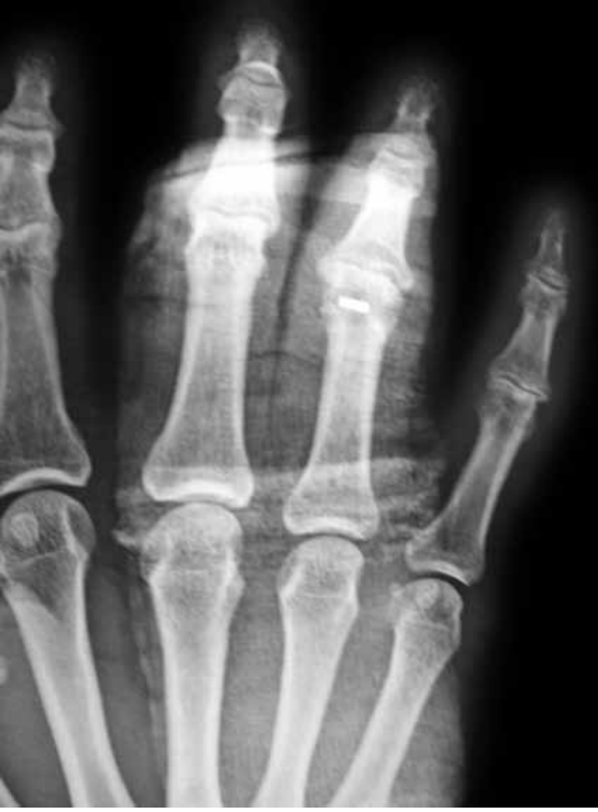
Şekil 4. Aynı hastanın kemik çapası kullanılarak yapılan bağ rekonstrüksiyonu.

sık görülür. Kısmi bağ yırtığı veya kaymamış, sıyrılarak kopmuş avülzyon kırığı ile çok az kaymış kollateral bağ için yalnızca immobilizasyon tedavisi yeterli olabilir. Yırtılan bağ elle palpe edilebilir. Metakarpofalangeal eklemin ekstansiyonda iken ulnar zorlama testi ile 35 dereceden fazla esnemesi bağ yırtığını göstermektedir. Çoğu durumda spora erken dönme için kemik çapa veya çekme (pull-out) dikişleri ile tamir artan sıklıkla önerilmektedir. [6]