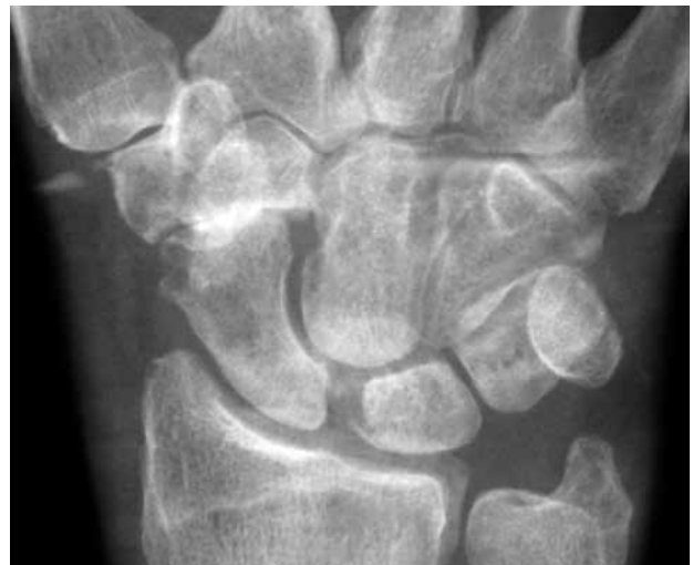
Şekil 1. Skafolunat aralığının 4 mm'nin üzerinde olduğu görülen bir olgunun ön-arka el bilek radyografisi.

Yaralanma sonrasında, el bileğinin radial tarafında ağrı ve şişlik gözlenir. Benzer yaralanma mekanizması