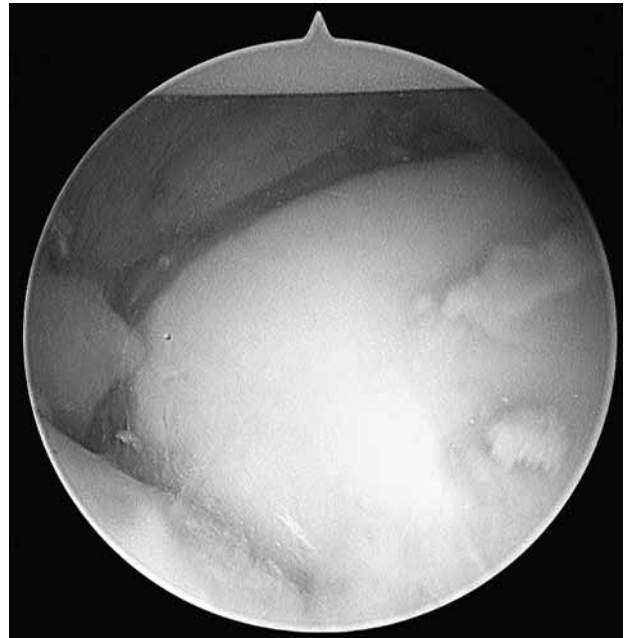
Şekil 3. Skafolunat interosseal bağı midkarpal eklemden değerlendirilmesi (skafolunat aralığının genişlediği izlenmektedir).