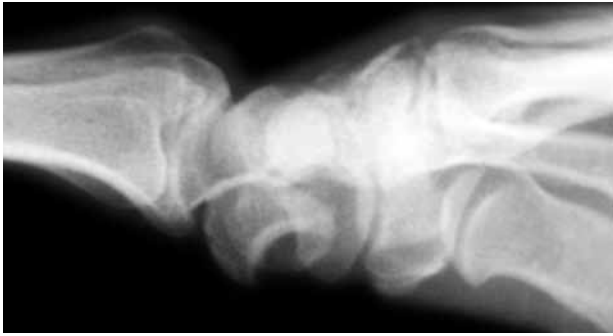
Şekil 4. Lateral el bileği radyografisinde os lunatumun bu görünümüne çay bardağına doğru düşme bulgusu "spilled tea cup sign" denir.

- El bileği, yaralanma esnasında hiperekstansiyonda ve ulnar deviasyonda olmalıdır.