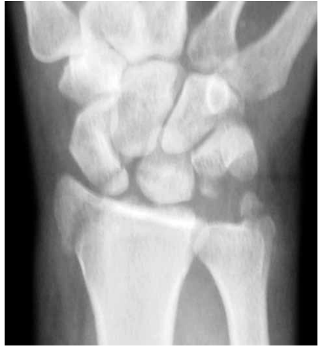
Şekil 5. Büyük ark yaralanmasına bir ön-arka el bileği radyografi örneği, (trans-stiloid trans-skafoid perilunat kırıklı-çıkık).

Perilunat yaralanmanın radyografik tanısında, kritik bölge os lunatumun komşu karpal kemiklerle