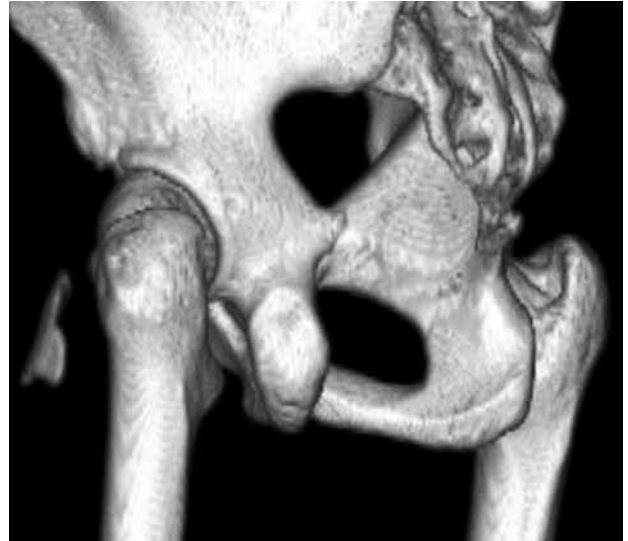
Şekil 3. Pelvik üç boyutlu bilgisayarlı tomografi rekonstrüksiyonda sol kalça lateralinde kemik yapılar ile bağlantısı olmayan kemik yapıda oluşum (pelvik kosta) izlenmektedir.

Pelvik kostanın oluşumu ile ilgili kesin bir bilgi yoktur. [5] Bununla birlikte embriyogenezin ilk altı