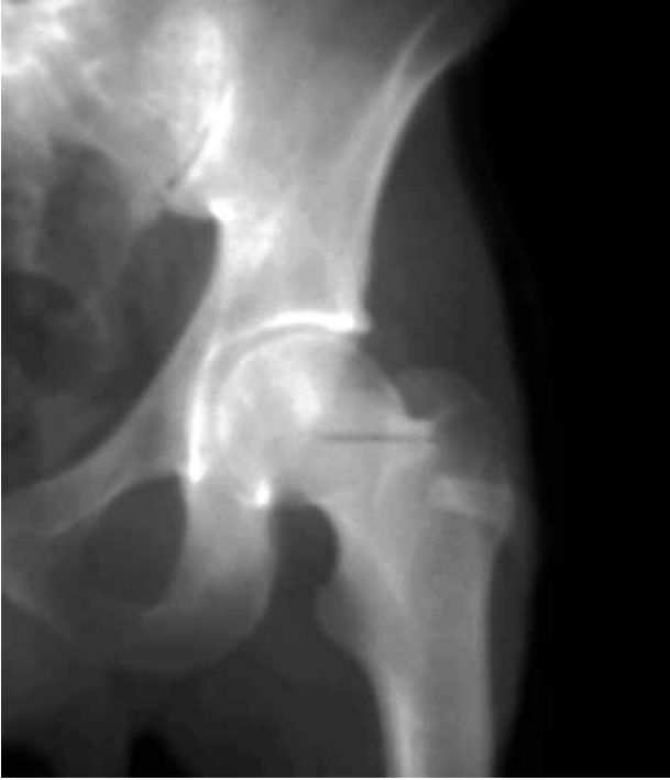
Şekil 1. Anteroposteriyör sol kalça grafisinde trokanter majör seviyesinde ve lateralde kemik yapıda oluşum (pelvik kosta) izlenmektedir.