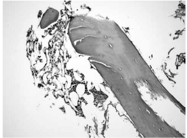
Şekil 5. Eksize edilen materyalin histopatolojik görüntüsü. Normal bir trabeküler kemik, ilik yağ dokusu ve kemik iliği hücreleri (H-E x 300).

Pelvik kosta olgularının çoğu asemptomatiktir ve tanı tesadüfen konulur. Cerrahi tedavi gerektirmeyen çoğu olguda histopatolojik değerlendirme de