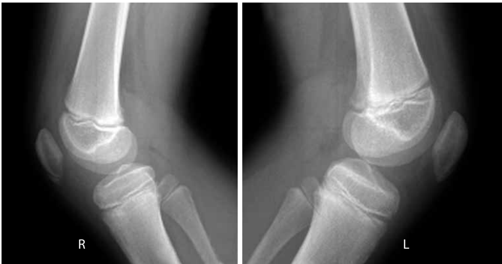
Şekil 1. İki taraflı Sinding-Larsen-Johansson lezyonu.

Sleeve kırıkları 8-12 yaş arası çocuklarda bildirilmiştir [10] ve aslında bir çeşit avülsiyon kırığıdır. Diz fleksiyonda iken kuadriseps kasının ani kasılması ile oluşur. [11] Ancak kırık hattı küçük bir kemik parça ile beraber eklem yüzeyinden nispeten büyük bir parçayı da içine alacak şekilde uzanır (Şekil 2a). [3,12] Ayrıca kırık hattı medial ve lateral retinakuluma da uzanıp ekstansör mekanizmaya ciddi hasar verebilir ve genelde inferiyör uçta yer alır. [3] Superiyör uçta yer alan sleeve kırıkları literatürde ancak olgu sunumu şeklindedir ve çok nadirdir.