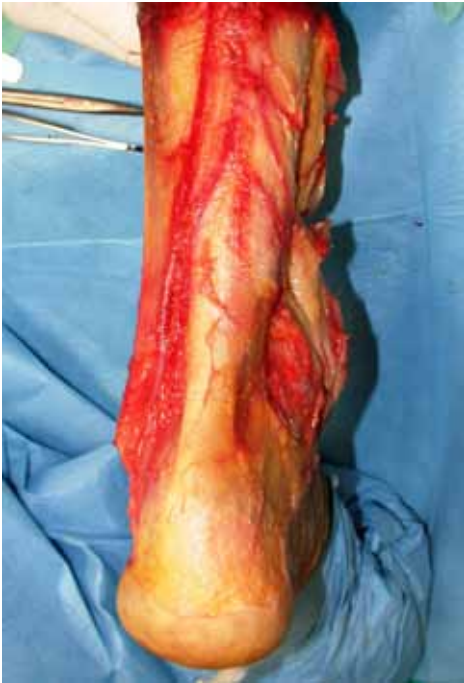
Şekil 3. Paratenonun kadaverik görüntüsü.