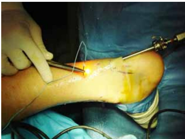
Şekil 6. Perkütan Aşil tendon onarımı.

Tibialis posteriyor tendonu subtalar kompleksin ayak arkası valgusu ve ayak önü pronasyonuna karşı