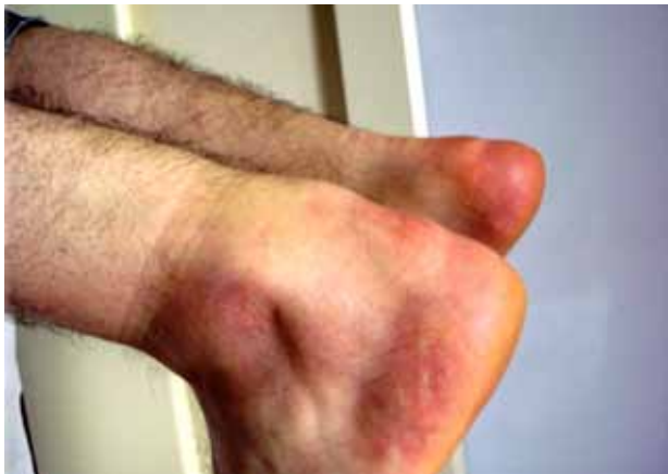
Şekil 2. Sol Aşil tendonunun ödemli görüntüsü.

Aşil tendinopatilerinin primer tedavisi konservatiftir. Cerrahi yaklaşım ancak konservatif tedavinin başarılı olmadığı inatçı olgularda düşünülmelidir. [84,85] Ağrıyı ortaya çıkaran aktivitelerin kesilmesi, istirahat ve soğuk uygulama öncelikli yaklaşımdır, ancak mekanik bir sorun saptandıysa bunun mutlaka düzeltilmesi gerekir. Biyomekanik değerlendirme sonrası fonksiyonel ortezler, topuk yükselticiler ve ayakkabı değişikliği önerilebilir. Konservatif tedavide son yıllarda özellikle eksenrik egzersiz yaklaşımları önemli yer tutmaktadır. [86] Germe ve kuvvetlendirme egzersizleri ile birlikte uygulanan fizik tedavi yöntemleri de tedavide etkin olarak kullanılmaktadır. [87] Lokal enflamasyonu ve ağrıyı azaltmak, doku iyileşmesini