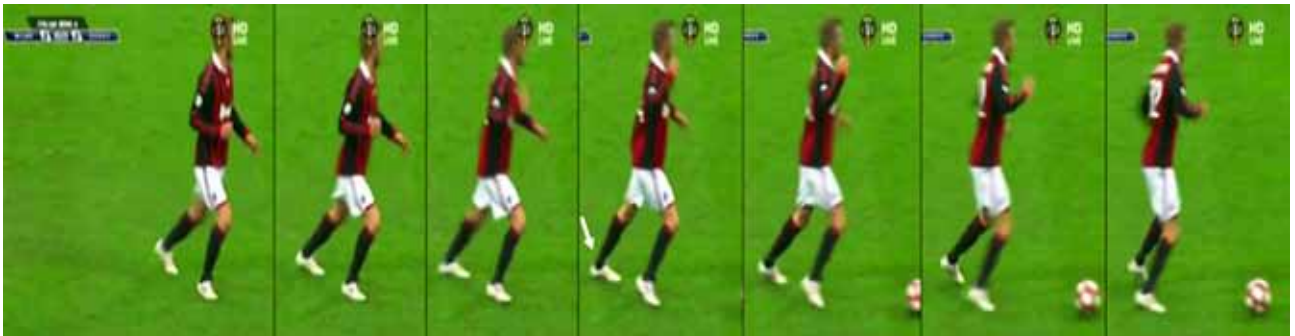
Şekil 5. Sol Aşil tendonu yırtığı oluşum mekanizması (diz ekstansiyonda iken ani olarak ayak önüne yük verilmesi ve ayağın dorsifleksiyona gitmesi şeklinde eksantrik yüklenme).

sık mekanizma diz ekstansiyonda iken ani olarak ayak önüne yük verilmesi ve ayağın dorsifleksiyona gitmesi şeklinde eksantrik yüklenmedir (Şekil 5). Akut yırtıkların %90'ı bu tip yaralanmalardır. Ayrıca yüksekte atlama sonrasında ayağın sert bir şekilde dorsifleksiyona zorlanması sonucunda da meydana gelebilir. [100] Aşil tendonu yırtıkları genellikle orta yaşlarda (30-50 yıl) ve erkeklerde daha sıktır. Etiyolojide en sık suçlanan neden dejeneratif tendinopatidir. [101] Bunun yanı sıra hipoksi, iskemik hasar, oksidatif stres, hiperkolesterolemi, hiperlipidemi, enflamatuvar mediyatörler, fluorokinolon grubu antibiyotik kullanımı ve matriks metalloproteinaz düzensizliği sorumlu tutulan diğer faktörler olarak gösterilmektedir. Aşil tendonunun kanlanmasını ortaya koyan mikrovasküler çalışmalar, Aşil tendonunun kalkaneal tüberküle yapıldığı yerden yaklaşık 4-6 cm proksimalinde göreceli bir hipovasküler bölge olduğunu göstermektedir ki Aşil tendon yırtıklarının büyük çoğunluğu bu bölgede oluşur. [102]