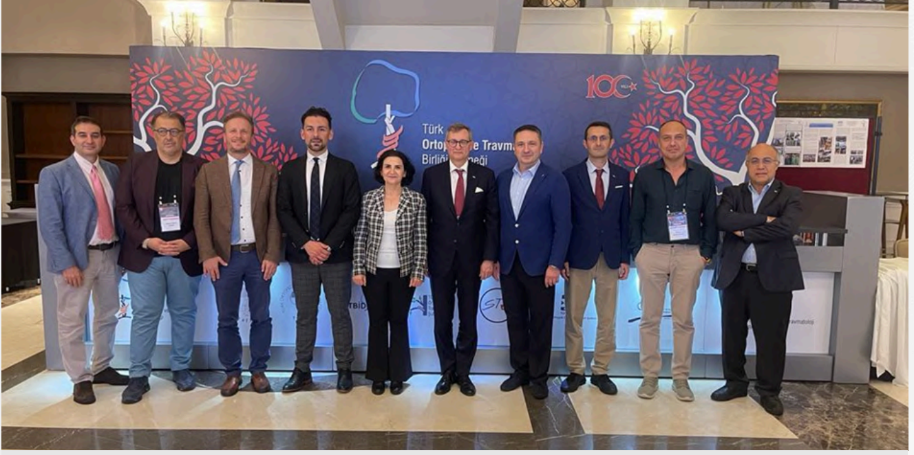
32. Ulusal Türk Ortopedi ve Travmatoloji Kongresi sırasında 3 Kasım 2023 tarihinde Titanic Deluxe Otel Belek'te yapıldı ve yeni TOTBİD yönetim kurulumuz seçildi.