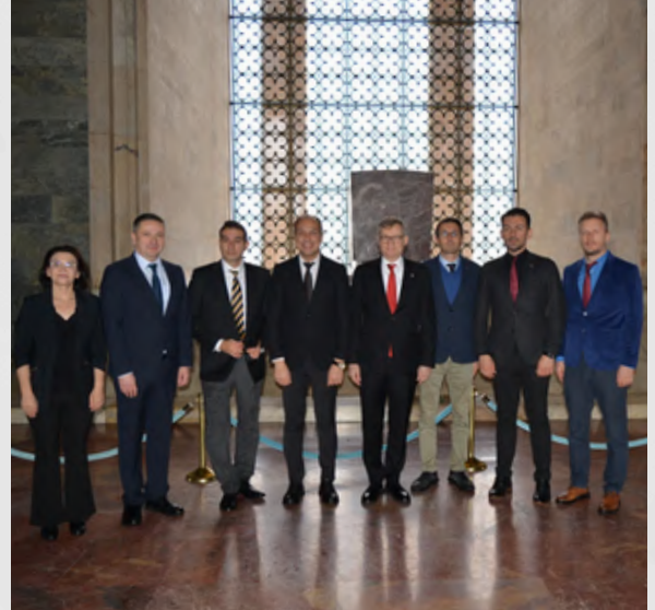
Yönetim kurulu ilk toplantısını 25 Kasım 2023 tarihinde gerçekleştirdi ve sonrasında Ulu Önder Mustafa Kemal Atatürk'ü Anıtı'nda ziyaret etti.