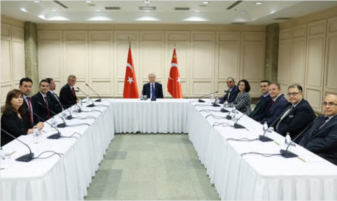
TOTBİD Yönetim Kurulu camiamızın sorunları ve taleplerini iletmek üzere Cumhurbaşkanı Sayın Recep Tayyip Erdoğan'ı Haliç Kongre Merkezi'nde ziyaret etti.