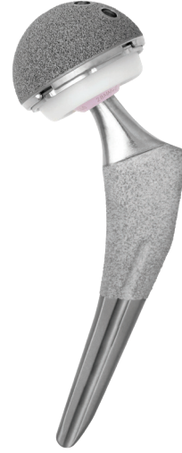
Accolade II ve Trident II