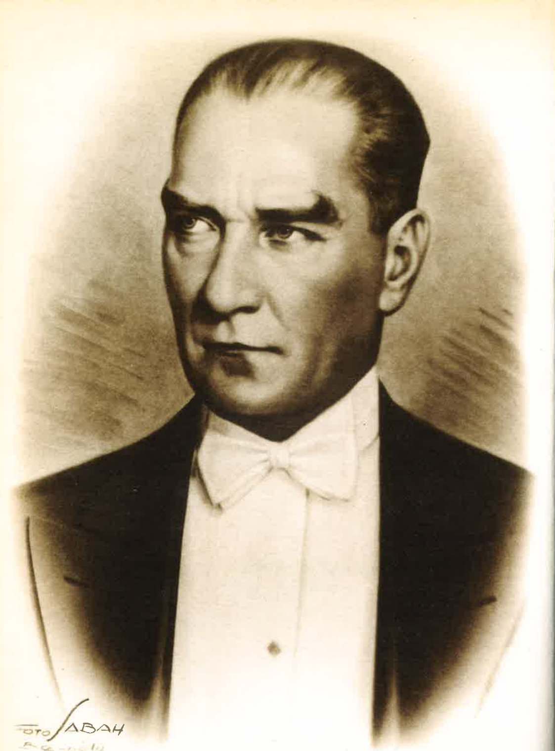
Ulu Önderimiz Mustafa Kemal ATATÜRK