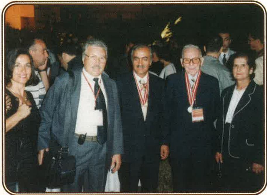
XVII. Milli Türk Ortopedi ve Travmatoloji Kongresi (Antalya 24-29 Ekim 2001)