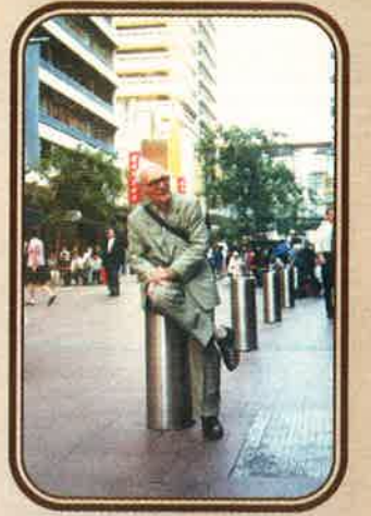
Bir Lider.